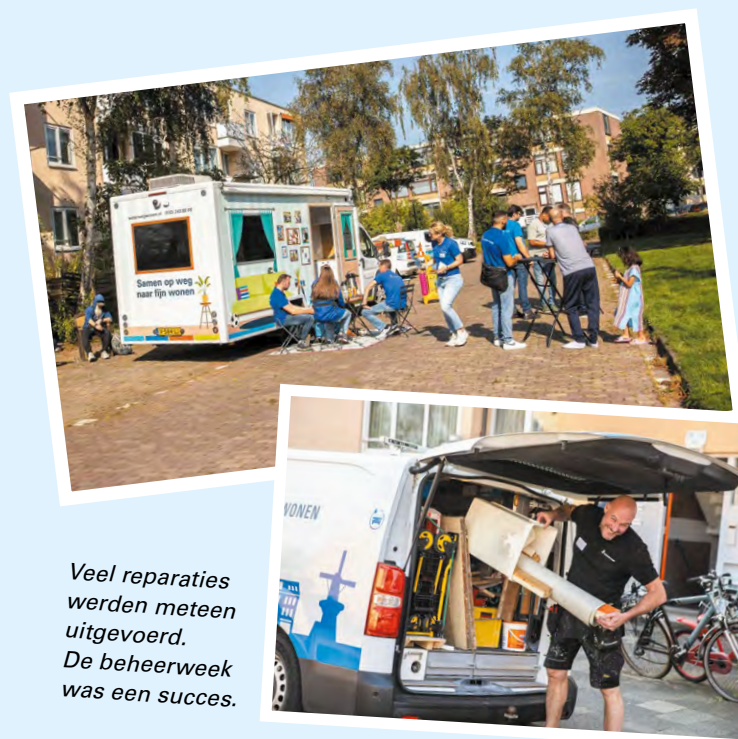
Veel reparaties werden meteen uitgevoerd. De beheerweek was een succes.