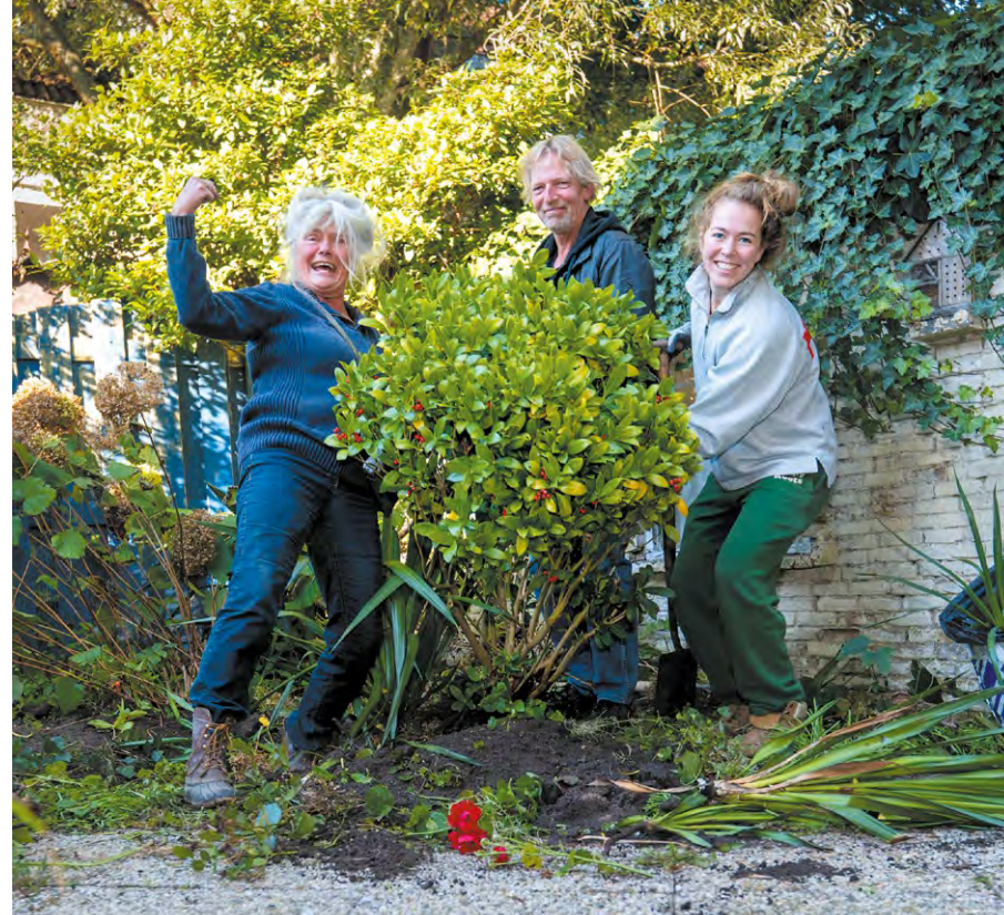
Het mooie groen uit de Zeevaardersbuurt kreeg een nieuw plekje.

Struikrovers en schatzoekers. En dat gewoon in onze Zeevaardersbuurt. Hier konden inwoners van Vlaardingen en omgeving vrij neuzen in de verlaten tuinen van sloopwoningen. Zagen ze een mooie plant? Dan mochten ze hem uitgraven en meenemen.