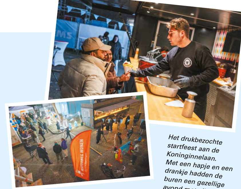
Het drukbezochte startfeest aan de Koninginnelaan. Met een hapje en een drankje hadden de burens een gezellige avond met elkaar.