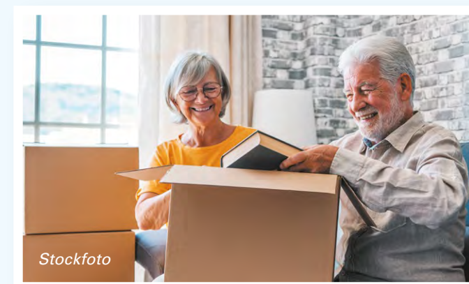
Ook interesse in doorstroming? Neem contact met ons op.